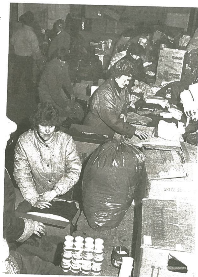
Centraal depot in bedrijfshal waar alle goederen nog eens werden bekeken.