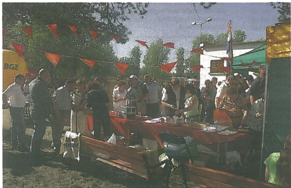
Hollanddag in Wronki op 2 mei '09 met Oud-Hollandse spellen en bitterballen.