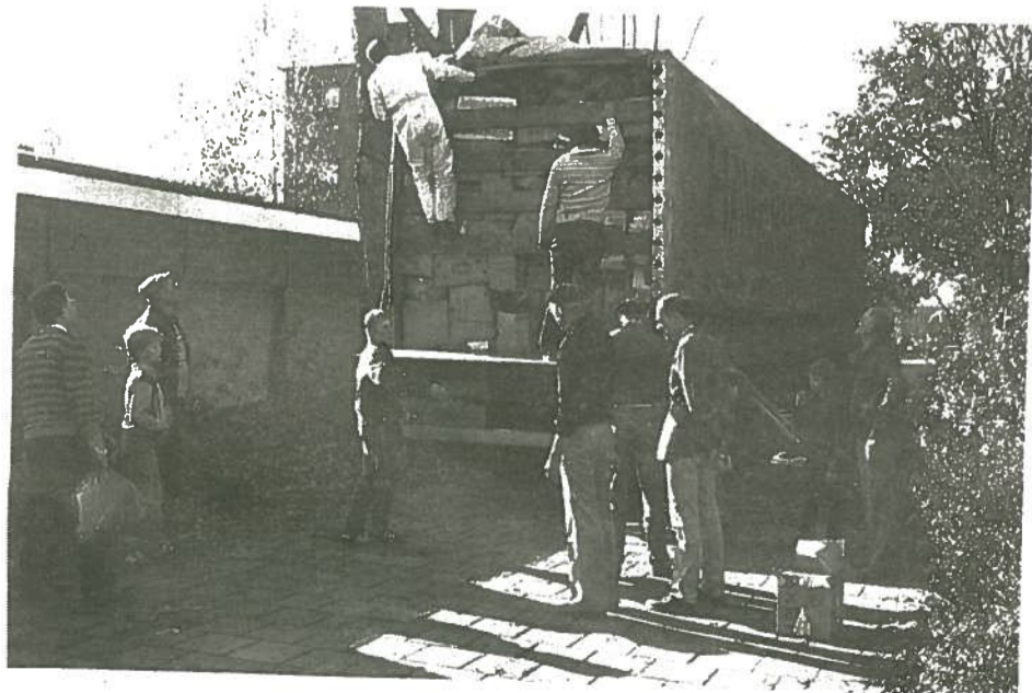
Een vrachtwagen in '96 tot de nok toe gevuld voor transport naar Polen.