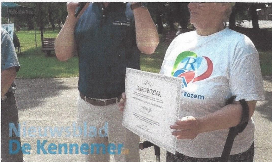
St. Stedenband Beverwijk-Wronki