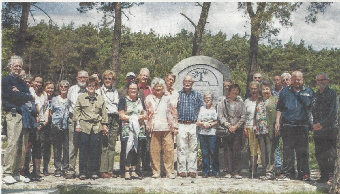
In 2015 bracht een groep IJmonders, allen deelnemers aan de jaarlijkse busreis aan Wronki, ook een bezoek aan het Joods Lapidarium. (archieffoto)