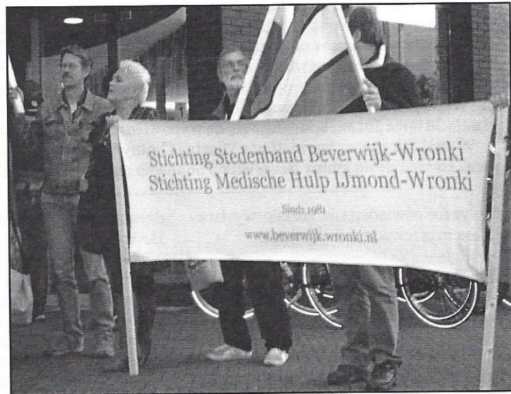
Milczący protest z flagami Polski i Wronek przed budynkiem Ratusza w Beverwijk w dniu 3 października 2013 r.