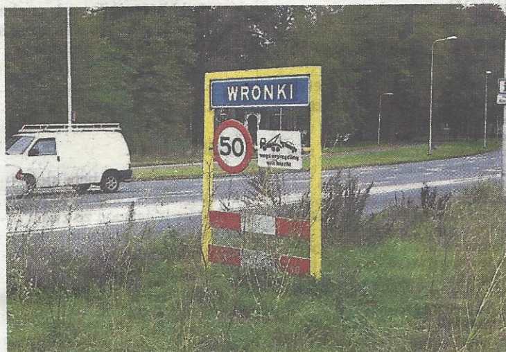
Welkom in Wronki.

Dat schrijft hij in een brief aan de Beverwijkse gemeenteraad, die juist na dertig jaar de band heeft beëindigd. Borkowski biedt aan te bemiddelen om de 'buitengewone' band in stand te houden.